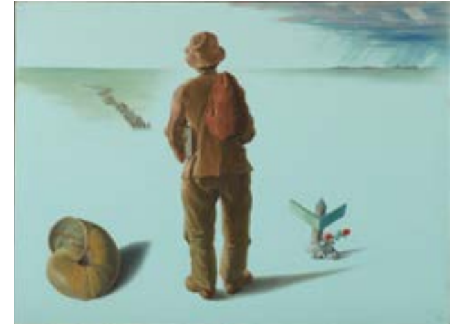
北脇 昇 「クォ・ヴァディス」 東京国立近代美術館 NMT000165 MOMAT/DNPartcom