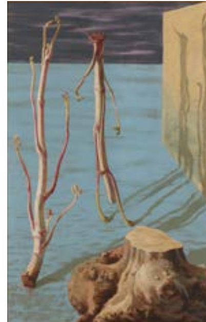
北脇 昇 「独活」 東京国立近代美術館 NMT000068 MOMAT/DNPartcom

「クォ・ヴァディス」／東京国立近代美術館 NMT000165 Photo: MOMAT/DNPartcom