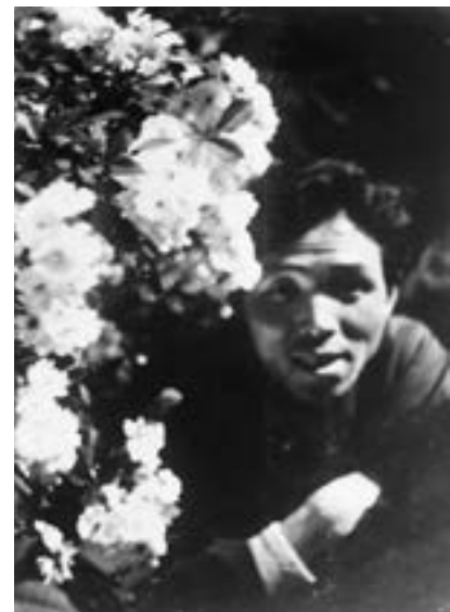
自宅にて 山茶花と北脇 昇

北脇 昇 II. 「山茶花」1936年作 油彩 紙ボード 左下に単漢字署名「乃」と「36」の年号 裏面 鉛筆による「北脇 昇」署名、 「山茶花」の画題 24.0.cm. × 33.0.cm. NOBORU KITAWAKI 'SAZANQUA' Oil on carton paper board, a single mark signature 'NO' with (19) 36 (year), with full name signature inscribed as KITAWAKI NOBORU , also entitled as 'SAZANQUA' by pencil on the back of carton paper board, 24.0.cm. × 33.0.cm.